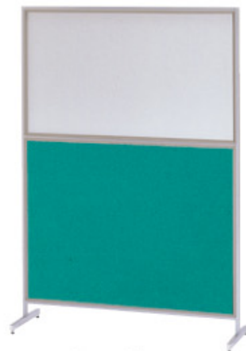
桜-64C (グリーン) JAN 120095