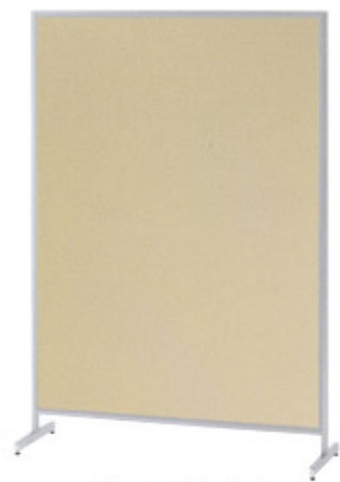
桜-64PC (ベージュ) JAN 119488