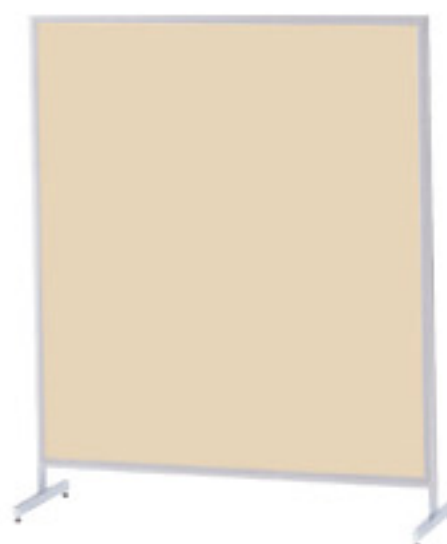
桜-54FP (アイボリー) JAN 050132