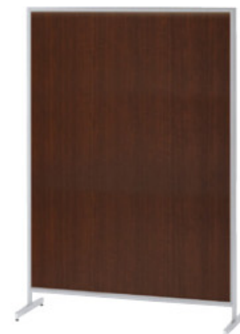
桜-64FP (ウォールナット) JAN 111116