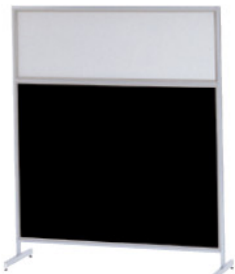
桜-54 (ブラック) JAN 111031