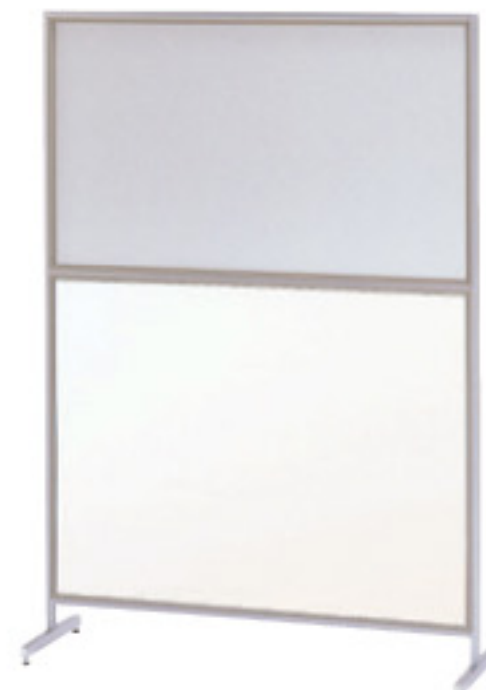
桜-64 (ホワイト) JAN 111109