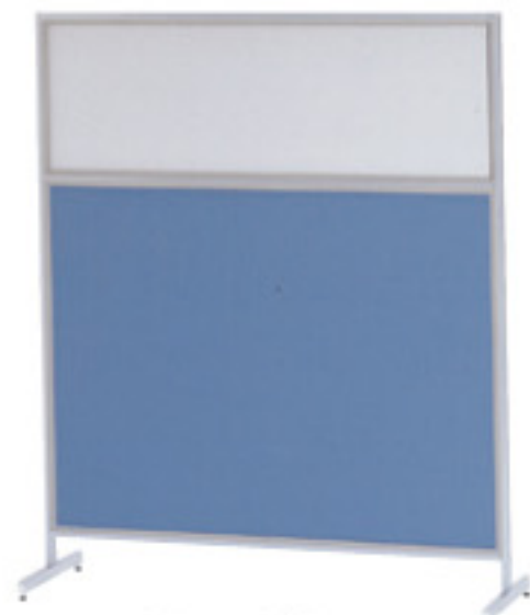
桜-54C (ブルー) JAN 049969