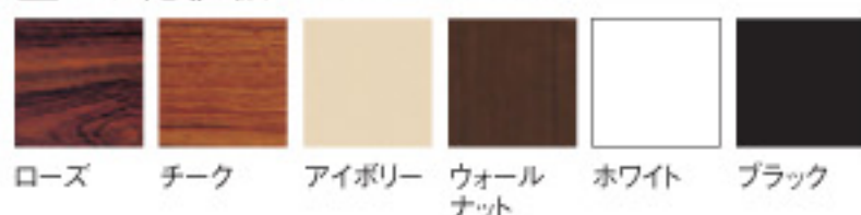
ローズ チーク アイボリー ウォールナット ホワイト ブラック