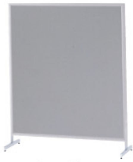
桜-54PC (グレー) JAN 068526